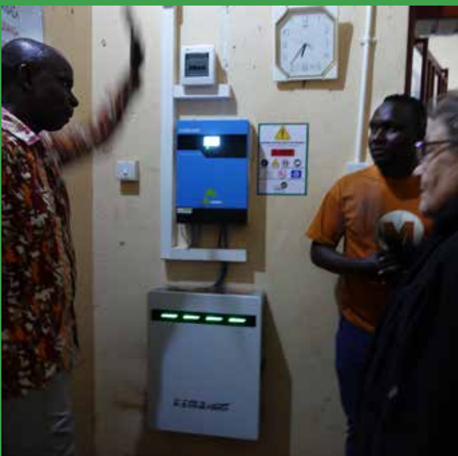
Lokalet hvor solcellerne styres fra.