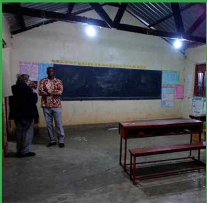
Klasseværelset med få møbler til mange børn.