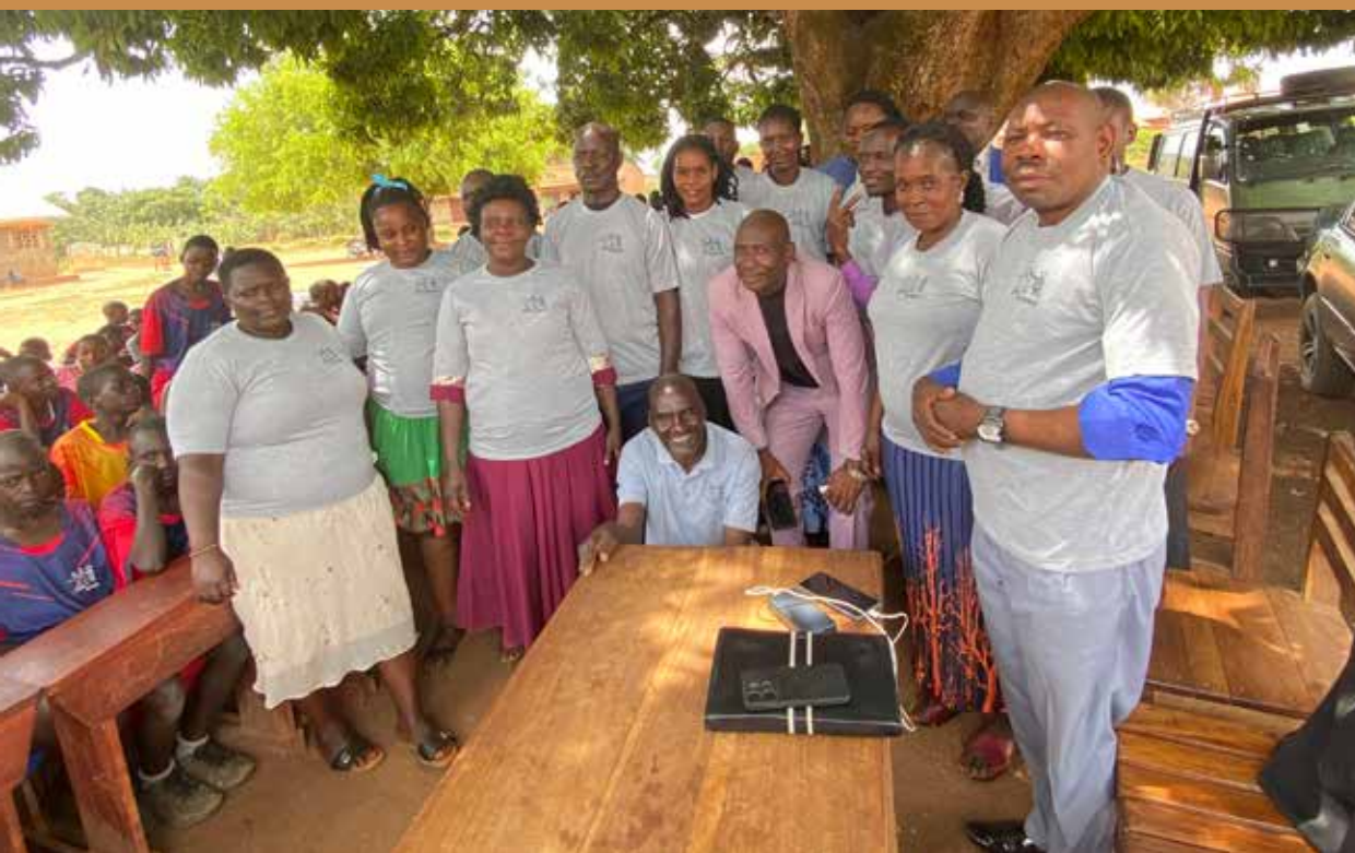
Skolebesøg i Kaliro med repræsentanter fra de 8 skoler Børn i Afrika samarbejder med.