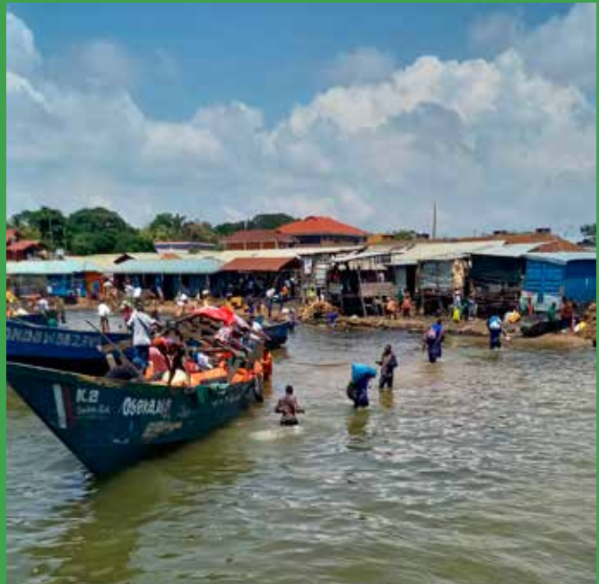
Den åbne båd for folk der ikke har penge til at sejle med en båd, som kan komme helt på land. De betaler for at de selv og deres bagage kommer tørskoet i land.