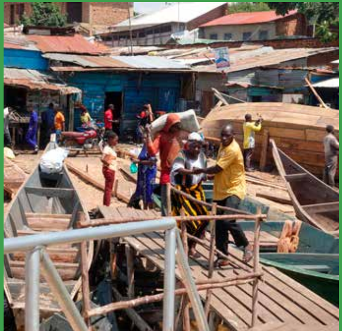
Stor aktivitet i alle de små havne.