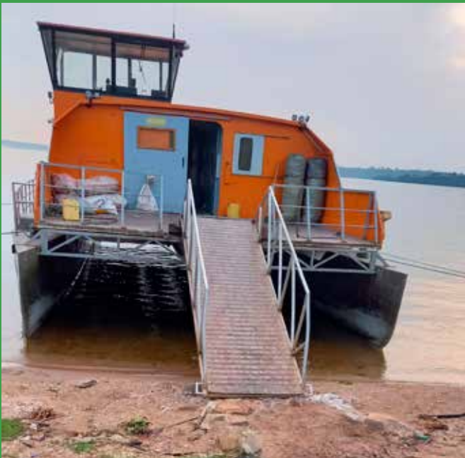
Den nye lokale færge.