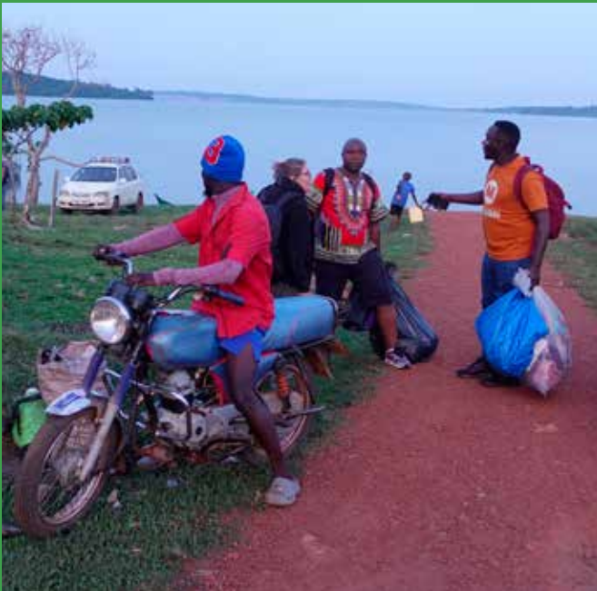
Vi forhandler med 2 lokale boda-boda chauffører, men må opgive den kørsel. På billedet ses øens eneste bil.