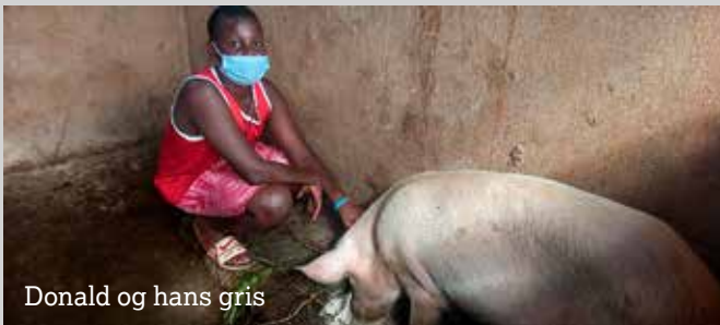
Donald og hans gris

Jeg vil råde andre børn til at finde på noget at lave og ikke være dovne. Kort sagt: Hårdt arbejde gør ondt, men det betaler sig.