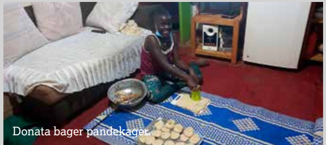
Donata bager pandekager

Når jeg vågner om morgenen, beder jeg og siger god morgen til mine forældre, derefter børster jeg tænder, så tager mit sjippetov og begynder at sjippe. Når jeg har sjippet, løber jeg 20 gange hen til porten og tilbage. Efter at have løbet tager jeg noget varmt vand at drikke og går i gang med at hjælpe med det daglige arbejde som at vaske køkkenredskaber, gøre rent i huset, muge ud ved grisene og arbejde i butikken. Når vi alle sammen er færdige med morgenarbejdet, spiser vi morgenmad og går derefter i gang med at repetere vores pensum. Efter at have repeteret beder vi vores klokken-3-bøn, og så spiser vi frokost. Efter frokost vi har lidt tid til at lege.